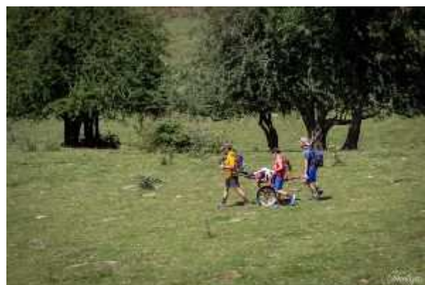
Solène - photo prise par L. Bacarisse 2019

8 août : première sortie montagne pour Solène en « Joëlette », entourée par les amis. Merci à l'association «Handicap Randonnées Pyrénées » de Monein pour le prêt du matériel